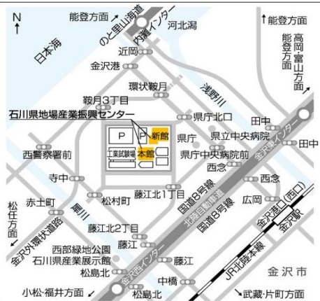
北信越ブロック会場地図