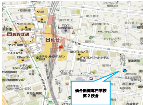
東北ブロック会場地図