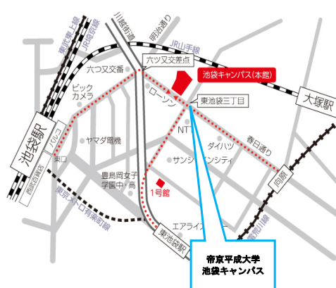
関東・東京ブロック会場地図