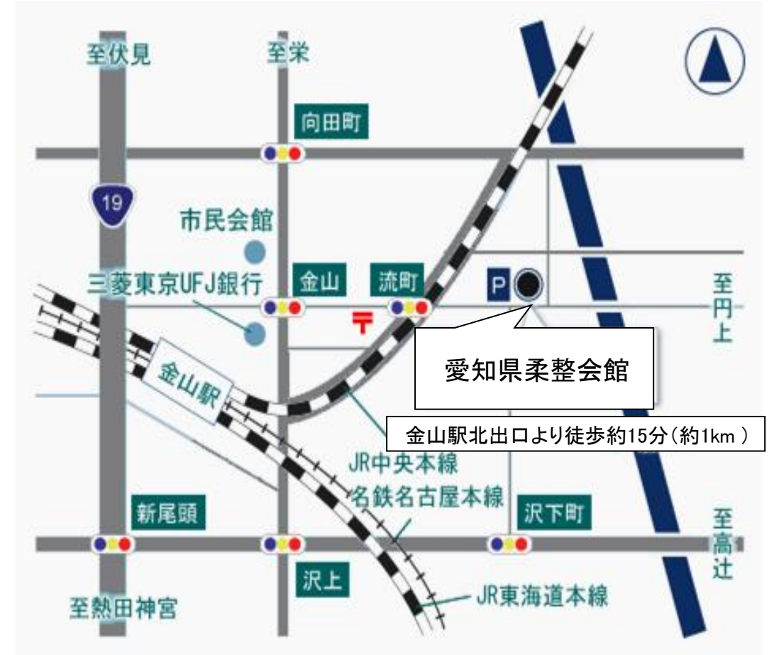
東海ブロック会場地図