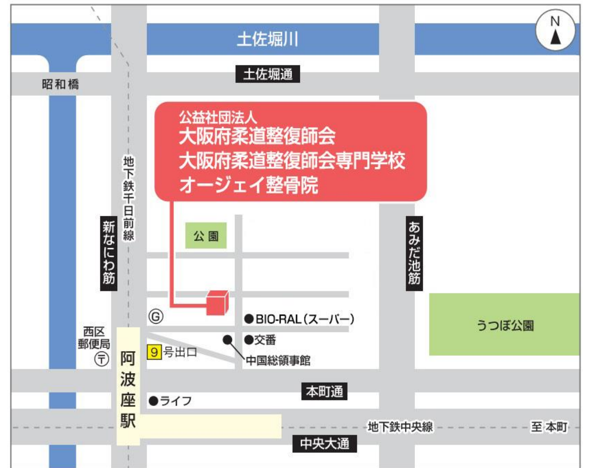
近畿・大阪ブロック会場地図