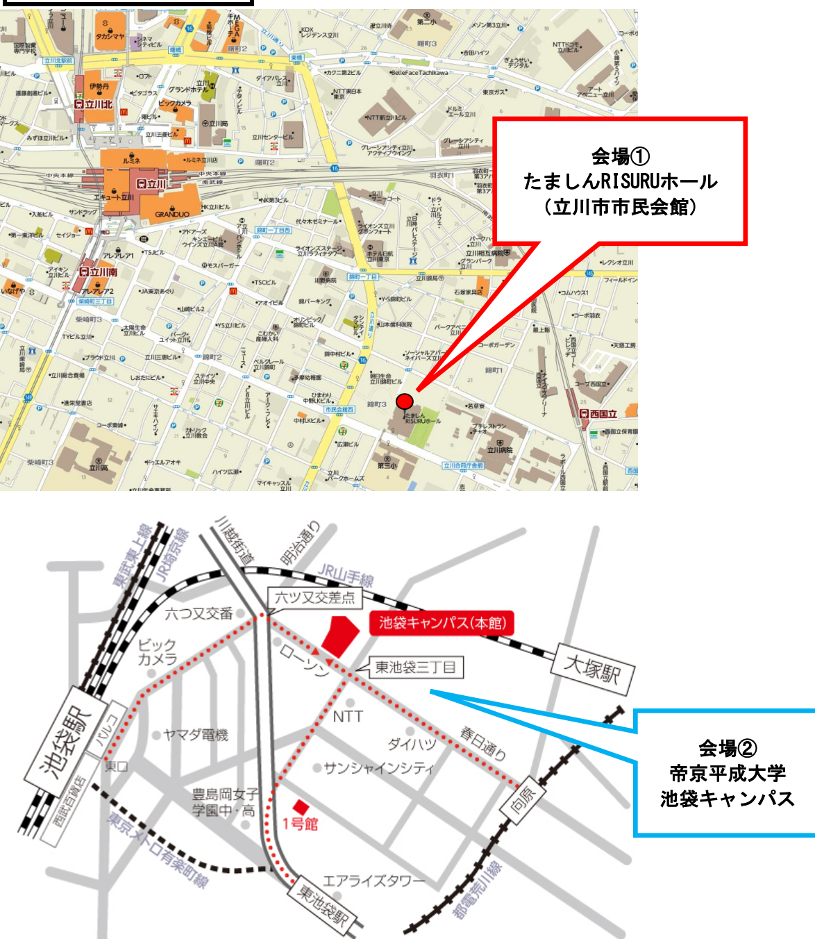
関東・東京ブロック会場地図