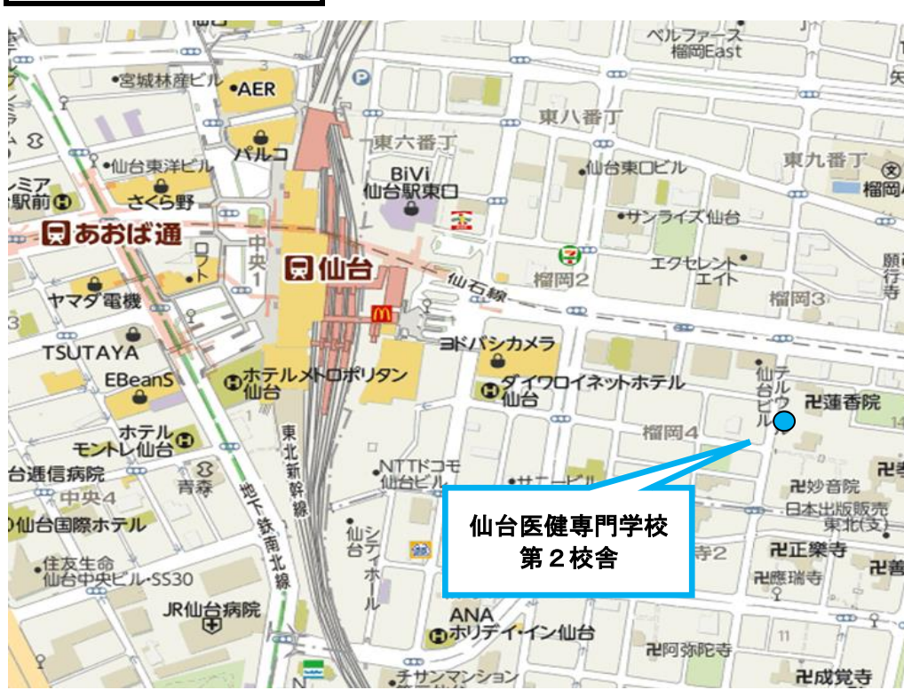
東北ブロック会場地図