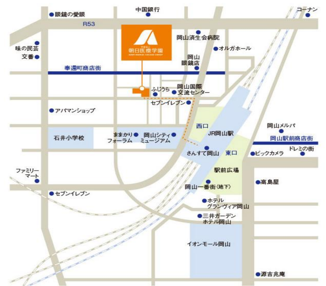
中国・四国ブロック会場地図